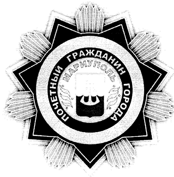
Рисунок нагрудного знака «Почетный гражданин города Мариуполя»

Нагрудный знак на оборотной стороне имеет нарезной штифт с гайкой для крепления знака к одежде.